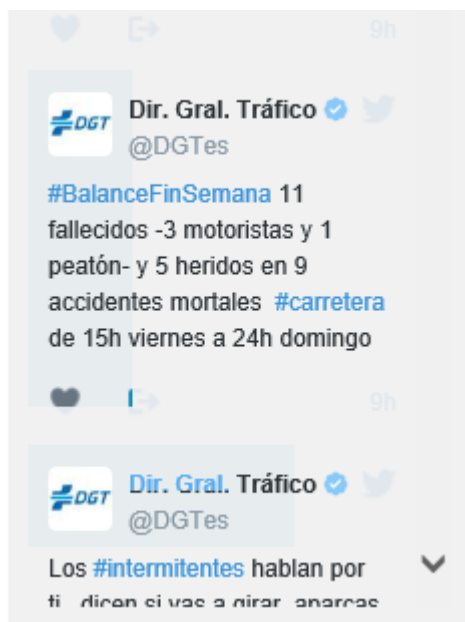
1 Siniestralidad según DGT

7 de los accidentes han sido del tipo "Colisión con otros vehículos", 6 del tipo "Salidas de vía" y 3 del tipo "Caídas en calzada".