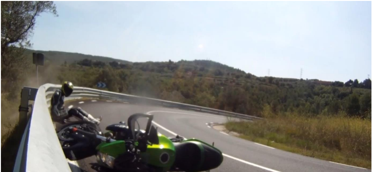
Imagen 5. Cumple con su obligación de retirar la motocicleta de la calzada.