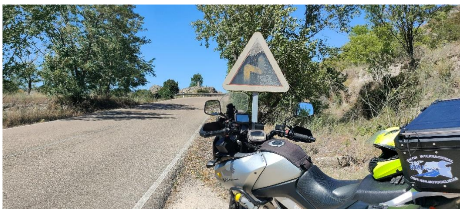
Imagen 3. Ejemplo vegetación en calzada.