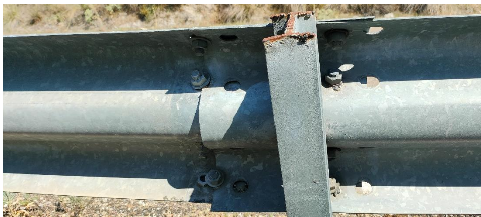
Imagen 8. Ejemplo. Detalle del estado del sistema de contención tipo barrera metálica de seguridad que incumple la OC 35/2014 y EN-1317 siendo ilegal y peligroso. Mecabizado, solapamiento y ausencia de piezas.