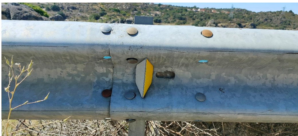
Imagen 6. Ejemplo. Detalle del estado del sistema de contención tipo barrera metálica de seguridad que incumple la OC 35/2014 y EN-1317 siendo ilegal y peligroso. Tornillería suelta. Par de apriete.