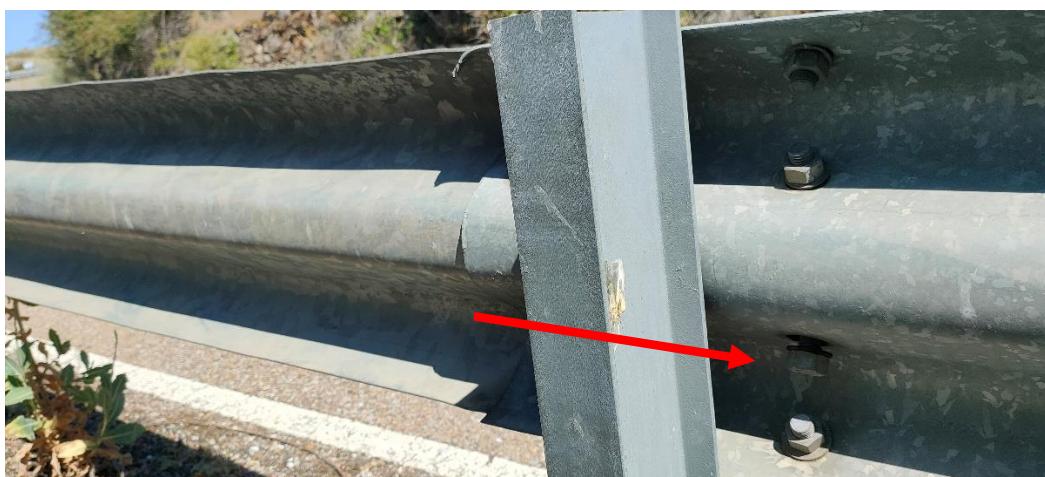
Imagen 7. Ejemplo. Detalle del estado del sistema de contención tipo barrera metálica de seguridad que incumple la OC 35/2014 y EN-1317 siendo ilegal y peligroso. Mecanizado, ausencia de piezas, etc.