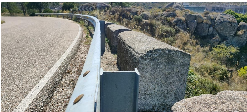
Imagen 5. Ejemplo. Detalle del estado del sistema de contención tipo barrera metálica de seguridad que incumple la OC 35/2014 y EN-1317 siendo ilegal y peligroso. Solapamiento ilegal.