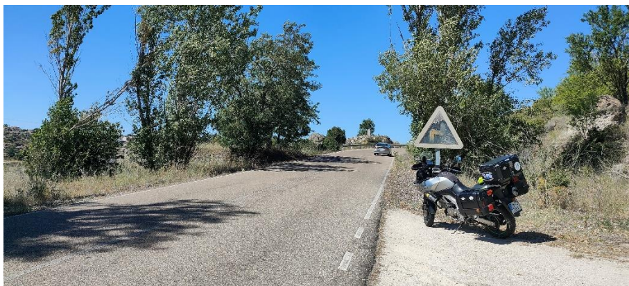
Imagen 2. Ejemplo. Ausencia de paneles direccionales en curva peligrosa.