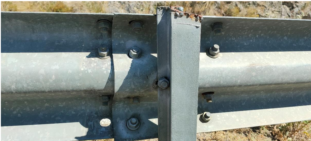
Fotografía 5. Zamora. Ejemplo de mecanizado, solapamiento incorrecto y ausencia de piezas.