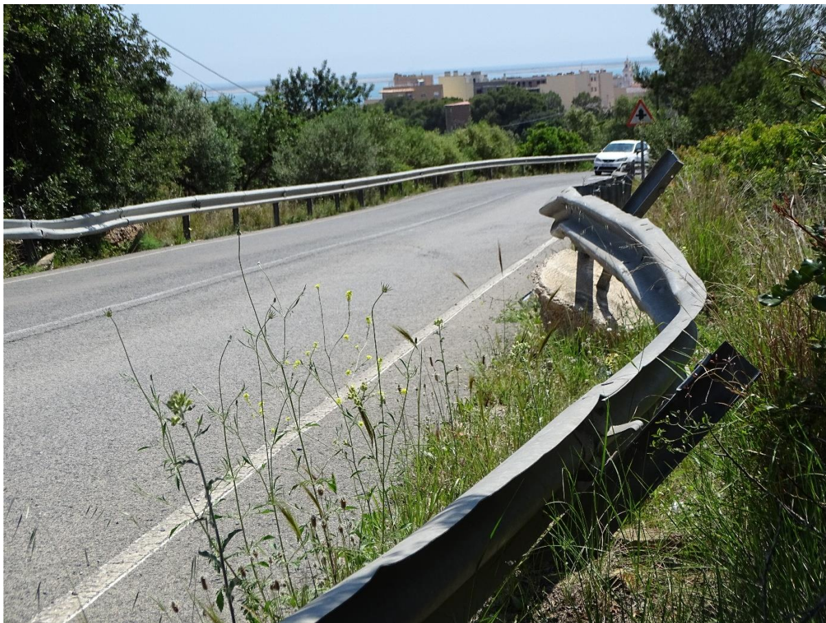
Fotografía 7. Getafe. Otro ejemplo de deformaciones graves en barrera de seguridad metálica.