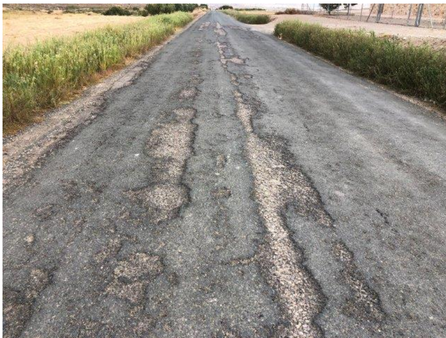
Imagen 2. Señalización en el año 2023. Obsérvese el estado de la señalización vertical, estado del firme, ausencia marca vial fin de calzada, ausencia hitos de arista, etc