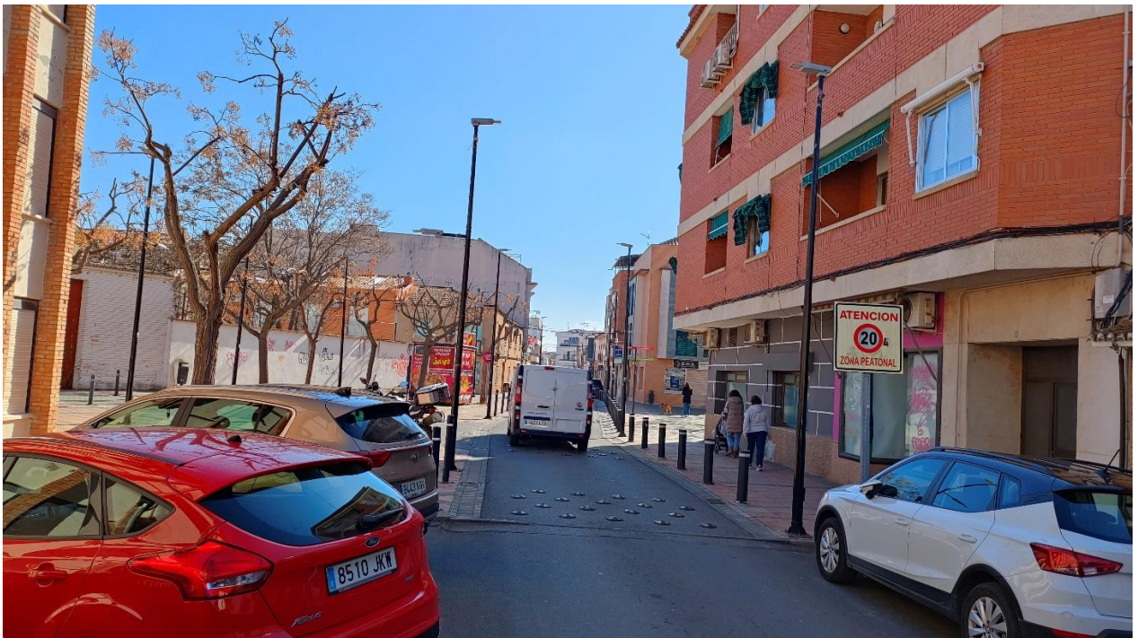
Imagen 1. Panorámica situación 1